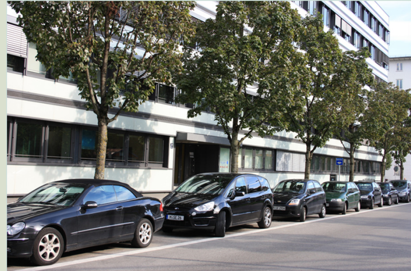
Bilder Außenansicht Pilgersheimer Straße 20