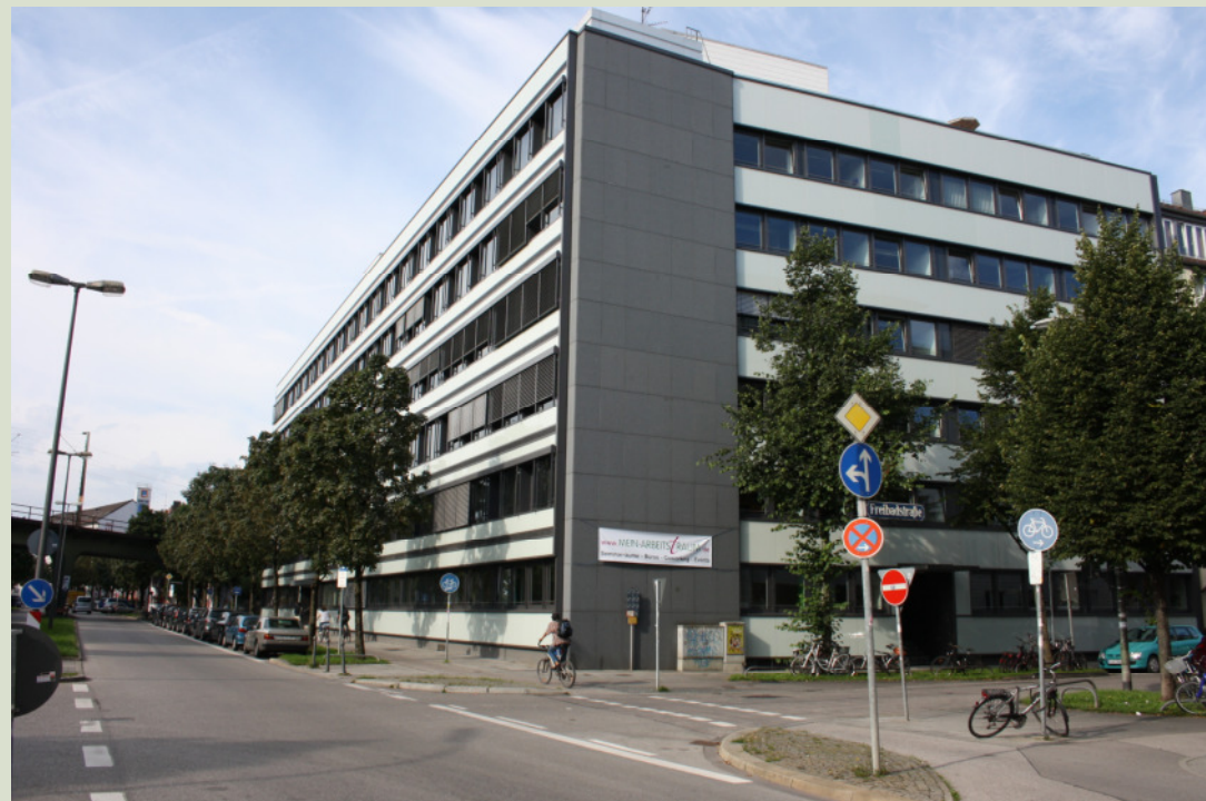
Gebäudeansicht Pilgersheimer Straße Ecke Freibadstraße